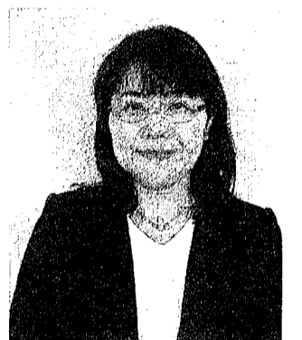
学校・保護者・地域が一つのチーム

平成は自然の驚異を見つめ直す日々でした。令和を迎え、新たな出会いと気持ちをもって、様々な行事に取り組んで行けたらと思います。